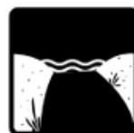
Tapis d'accès à la plage