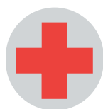
Poste de secours accessible*