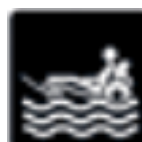
Système d'aide à la baignade**