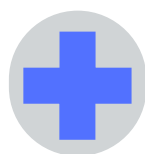
Plage surveillée et/ou Poste de secours*